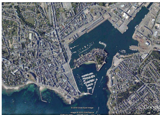
Vue aérienne de Concarneau, 25/07/2010.