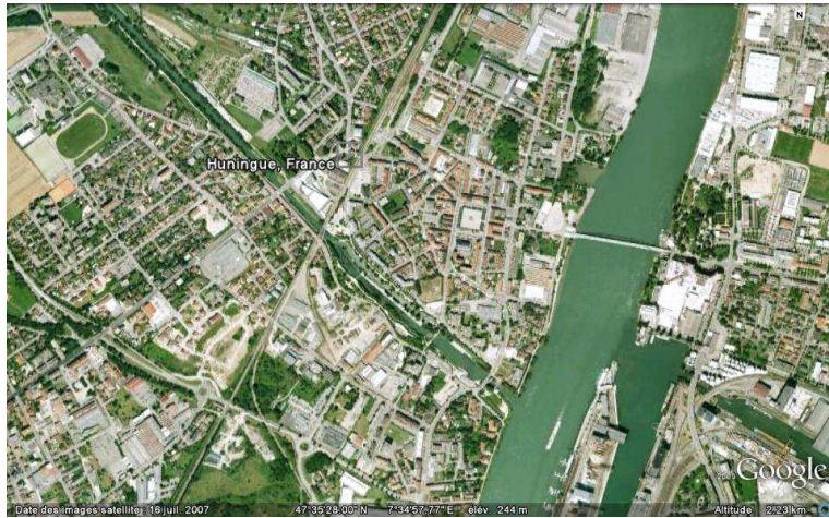
Vue aérienne d'Huningue, GoogleEarth, 07/08/2010.