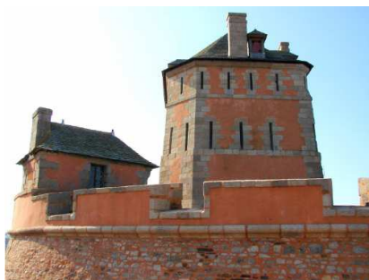
La tour Vauban en 2010

Depuis 2007, la municipalité de Camaret-sur-Mer a entrepris la restauration des enduits extérieurs de sa tour Vauban. Après la réfection de la tour (2007-2008), le chantier a repris en 2009 avec la restauration de l'escarpe et de la contrescarpe (murs tapissant le fossé qui ceinture la tour, dans lequel la marée pénètre par infiltration). Première phase des travaux : libérer les pierres de toute végétation, retirer les joints et remplacer les pierres trop endommagées ; à laquelle a suivi l'application du fameux enduit rouge orangé, qui valut à la tour son surnom de « Tour dorée ». Celui-ci a été posé conformément aux techniques du XVII e siècle. Sa couleur et sa composition exacte ont été déterminées avec précision en 2007 par le Laboratoire de recherche des Monuments historiques, avant son application sur l'ensemble de la tour. Ce chantier de presque 3 ans s'est officiellement achevé le 24 mars dernier en présence du Conservateur régional des Monuments historiques. Mais les travaux ne s'arrêtent pas là ! Une 2 e tranche sera engagée sur le pont levis, le four à boulets et le corps de garde après le rendu d'une étude approfondie de la part de l'Architecte des bâtiments de France. Enfin la 3 e étape de ce vaste chantier consistera dans les prochaines années à la restauration intérieure de la tour, qui se doublera de l'application d'un nouveau projet scientifique et culturel pour le site.