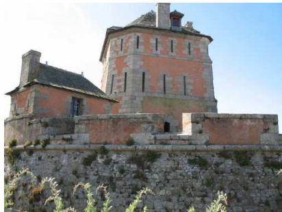
La tour Vauban en 2007